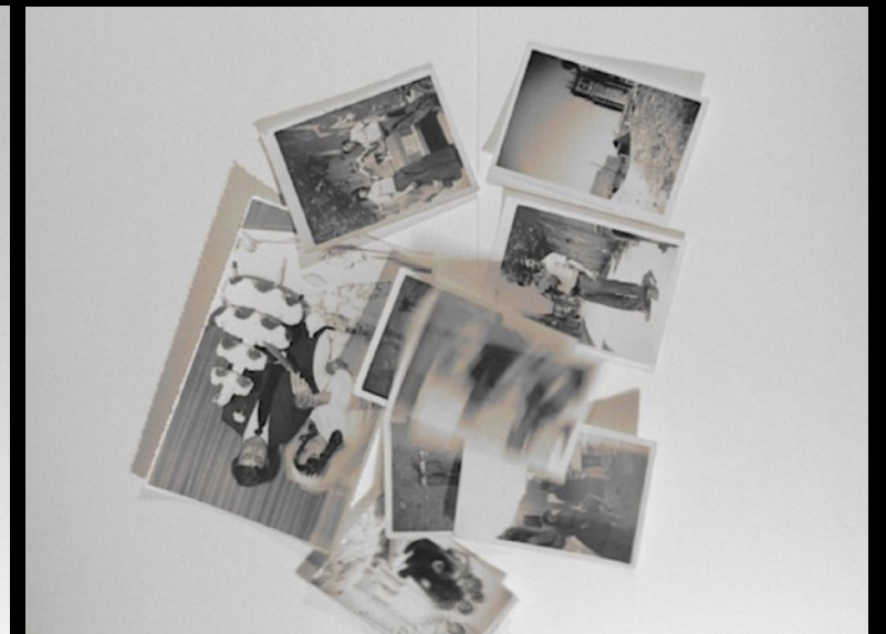
ACTO II. Desarrollo/Explicación: Historia de Antonia