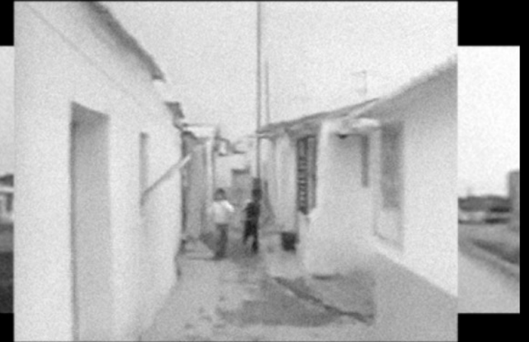
ACTO I. Introducción: Antonia Torre