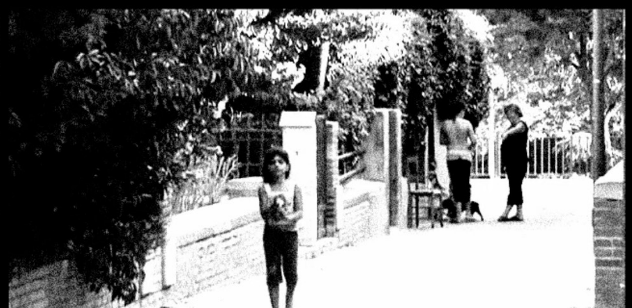
ACTO III. Conclusión: Carta de una madre a un hijo